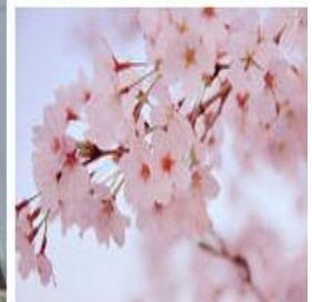
現在の角館南高等学校